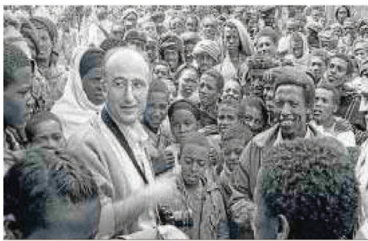
El fotógrafo Juan Manuel Castro Prieto.

En el caso de Fibla (Barcelona, 1946), el jurado quiso destacar "la versatilidad y la calidad de su obra", muy extensa y que incluye más de 300 títulos traducidos al castellano, principalmente novelas y ensayos. Algunos de los autores más relevantes de la literatura